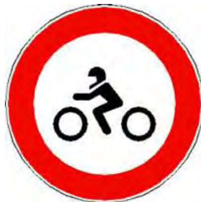
Transito vietato ai motocicli