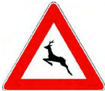
Animali selvatici vaganti