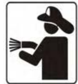
Vigili del fuoco