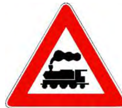
Passaggio a livello senza barriere