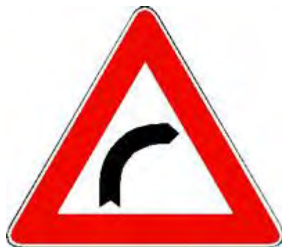
Curva pericolosa a destra