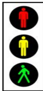
Semaforo per pedoni