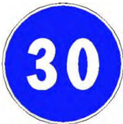
Limite minimo di velocità