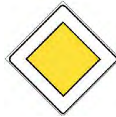
Diritto di precedenza