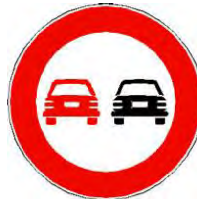
Divieto di sorpasso