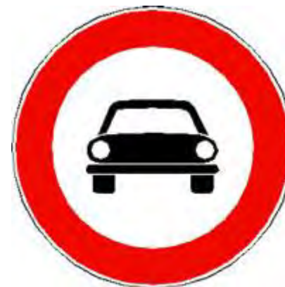
Transito vietato a tutti gli autoveicoli