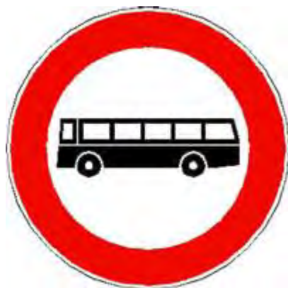
Transito vietato agli autobus