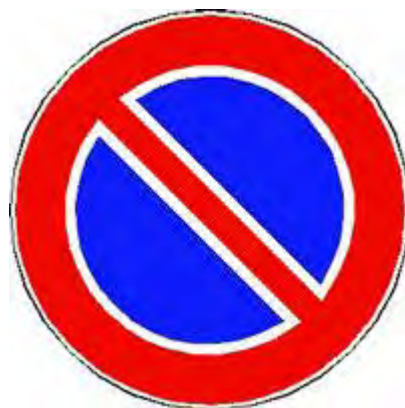
Divieto di sosta