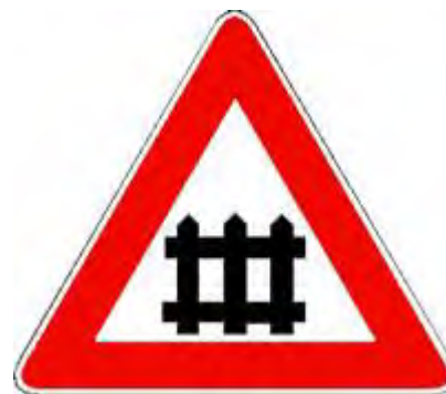
Passaggio a livello con barriere