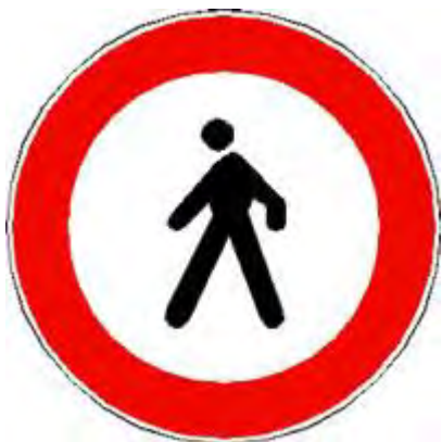
Transito vietato ai pedoni