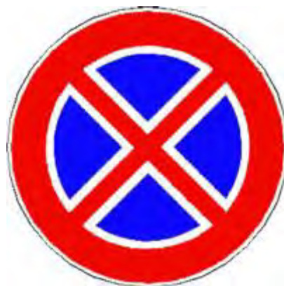
Divieto di fermata