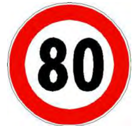
Limite massimo di velocità