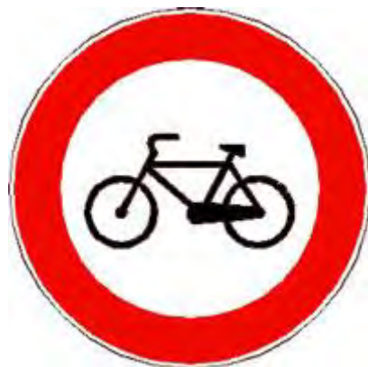
Transito vietato alle biciclette