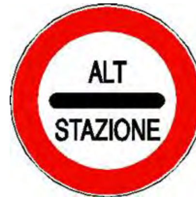
ALT - STAZIONE