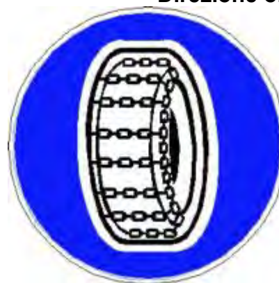
Catene per neve obbligatorie