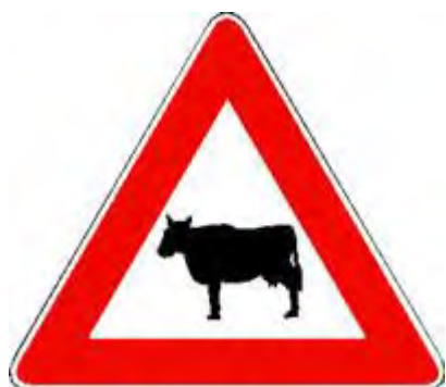
Animali domestici vaganti