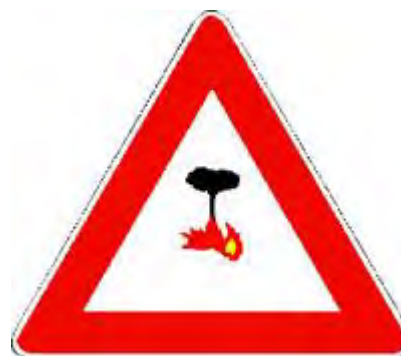
Pericolo di incendio