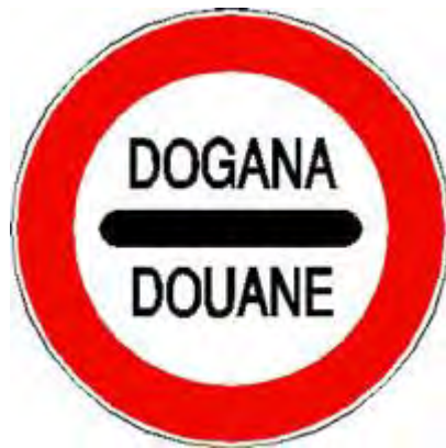
ALT – DOGANA