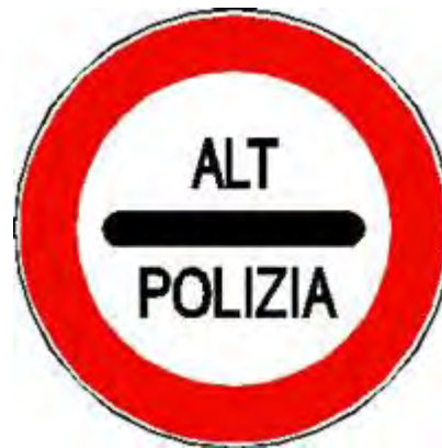
ALT – POLIZIA