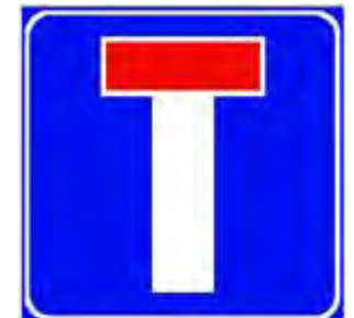
Strada senza uscita