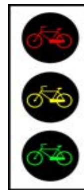
Semaforo per biciclette