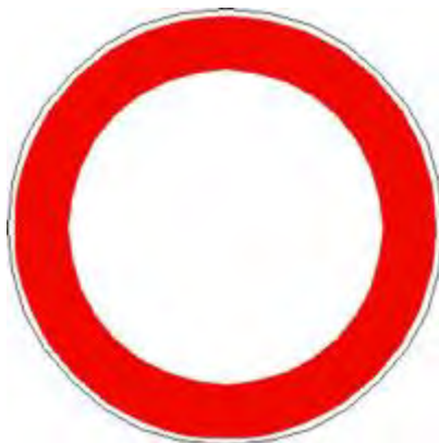
Divieto di transito

con forma circolare; si dividono in generici o specifici