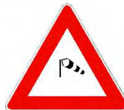
Forte vento laterale