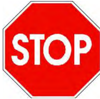
Fermarsi e dare precedenza